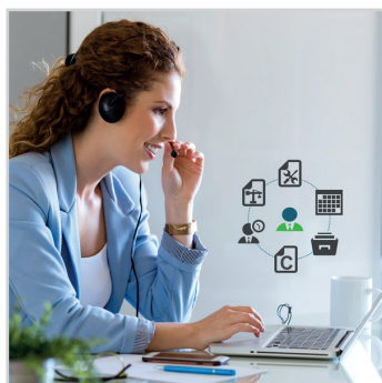
CENTRE D' ACTIONS ET D' APPELS