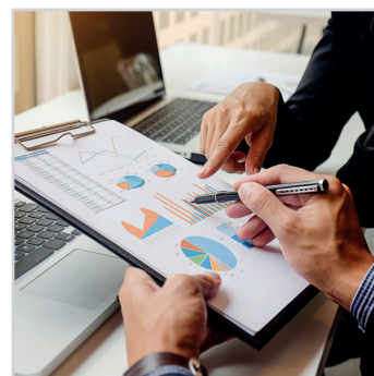
DÉCISIONNEL, STATISTIQUES PERSO.