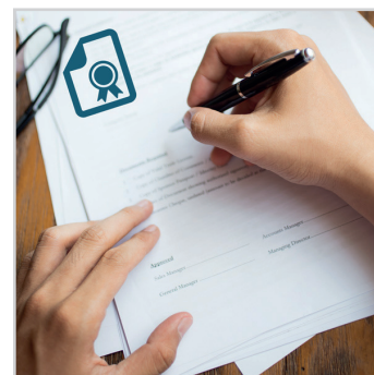
GESTION DES CONTRATS