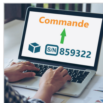
RÉSERVATION D' ARTICLES