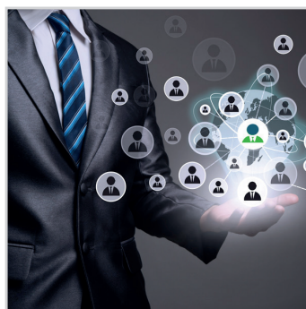
CRM, SUIVI DE LA RELATION CLIENT